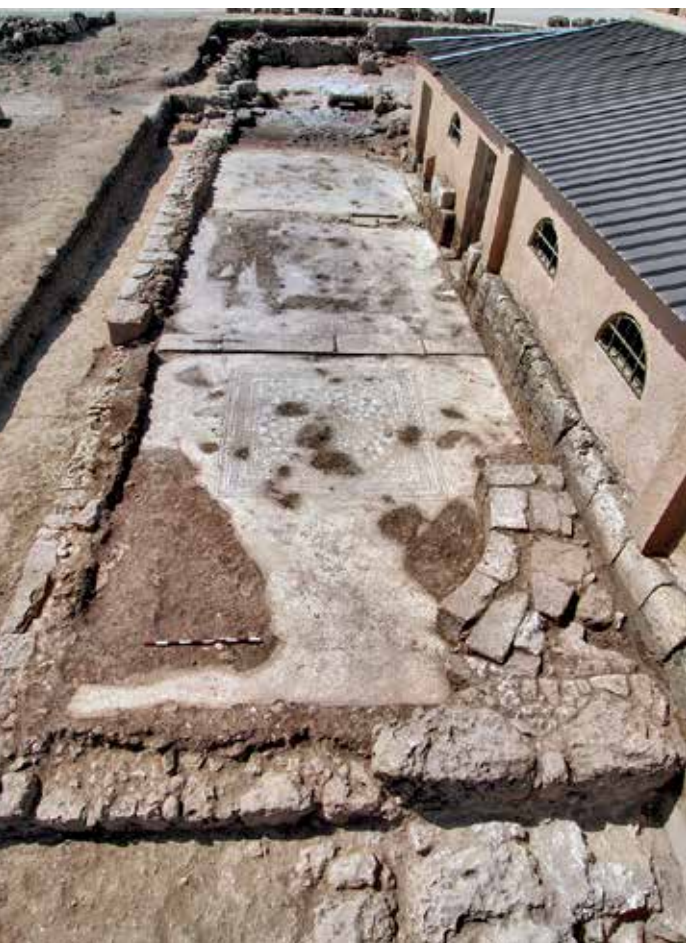
איור 5: מבט על כנסיית הבסיליקה

האזכור הראשון של שילה במקרא הוא בספר בראשית (מט, 10) בברכת יעקב לבנו יהודה. הברכה משקפת ומרמזת על העתיד לקרות בשילה, כפי שבא לידי ביטוי בספר יהושע. בשילה, כפי שבא לידי ביטוי בספר יהושע ובספר שמואל אירעו מספר אירועים המהווים ציון דרך בתולדות עם ישראל בראשית דרכו בארץ כנען, עם יציאתו ממצרים. שילה הייתה למרכז הדתי הראשון של בני ישראל. בשילה שכן ארון הברית ובמלחמה עם הפלישתים נלקח ארון הברית בידי הפלישתים ושני בני עלי נהרגו (שמואל א ד, יא). כאן נקהלו כל עדת בני ישראל ובמקום הזה הפיל (ירה) יהושע את גורל הנחלות (יהושע יח, 1; כב, 12). בשילה חנה, אשת אלקנה, התפללה לה' ותפילתה נענתה וזכתה להביא ילדים לעולם. את בנה הראשון, שמואל, מסרה לעבודת השם אצל עלי בבית האלהים. שילה היה המקום בו חונך ופעל שמואל וה' נגלה אליו (שמואל א, ג, 21). בשילה, אשר מצפונה לבית אל מזרחה השמש למסילה העולה מבית אל שכמה ומנגב לבונה, נחוג חג לה' (שופטים כא, 19).