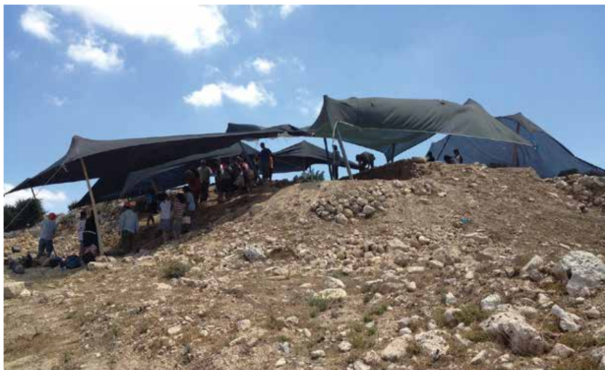
איורים 13: מבט על החפירות

מהתקופה הרומית הקדומה. מצדו המזרחי של הרחוב נתגלה בית בד לתעשיית בשמן. ראשיתו כבר בתקופה החשמונאית והוא המשיך לשמש עד לתקופה הביזאנטית והערבית הקדומה (איור 11 - מבט כללי על החפירות במדרון הדרומי). בחפירות שנערכו במשטח הצפוני, כהמשך לחפירות שערך ז' יבין, התגלו שכבות יישוב מהתקופות הברונזה התיכונה המעידה על התיישבות מחוץ לשטח התל. בתקופת הברזל, ככל הנראה, המשטח היה כבר מעוצב בצורתו הנוכחית בעקבות פעולות כריה לצורך דיפון החלקלקה. בחלק זה הייתה התיישבות גם