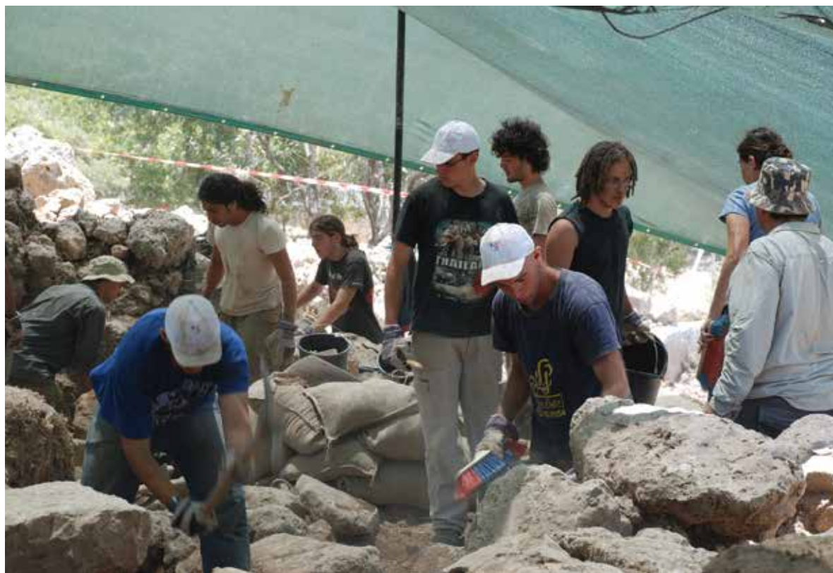
איור 3: בני נוער בחפירות

שילה וסביבתה ואף סירו במרחב אזור בנימין (איור 3 - בני נוער בחפירות).