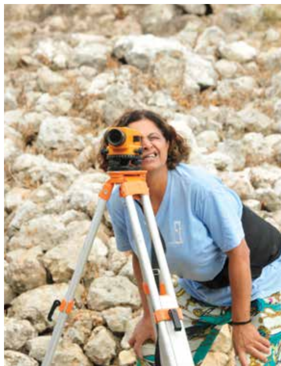
איור 2: מתנדבת בעת שימוש במכשיר מדידה

עבודתו של הארכיאולוג החופר מראשית הנעיצה של המקוש או המעדר בקרקע, השימוש במכשירי מדידה (איור 2 - מתנדבת בעת שימוש במכשיר מדידה) ועד ניקיונם של החרסים במים. כן למדו את הטיפול בממצא הזעיר, אם המטבע או כלי זכוכית שנחשפו במהלך החפירה. בנוסף, המתנדבים עברו הדרכות והרצאות על