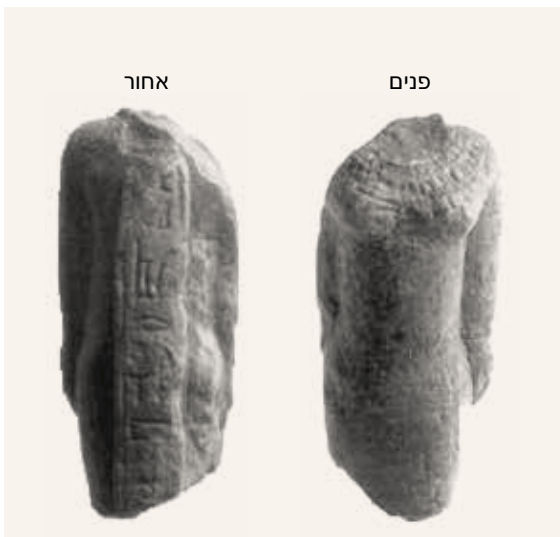
איור 7: הצלמית איסיס

במדרון המזרחי של תל נחשפה חומה הברונזה התיכונה שהקיפה את העיר, כ-17 דונם שטחו. אל החומה, שרוחבה 3-5 מ', נגשה חלקלקה, שבחלקים מסויימים אורכה הגיע עד 25 מ', עוביה כ-6.5 מ' ושיפועה נע בין 25-20 מעלות. החלקלקה הייתה בנויה מספר רבדים, שאחד מהם היה אפור צהבהב, בדומה לזה שנחשף במשטח הצפוני (להלן). ברבדים של החלקלקה נמצאו ממצאים המעידים על