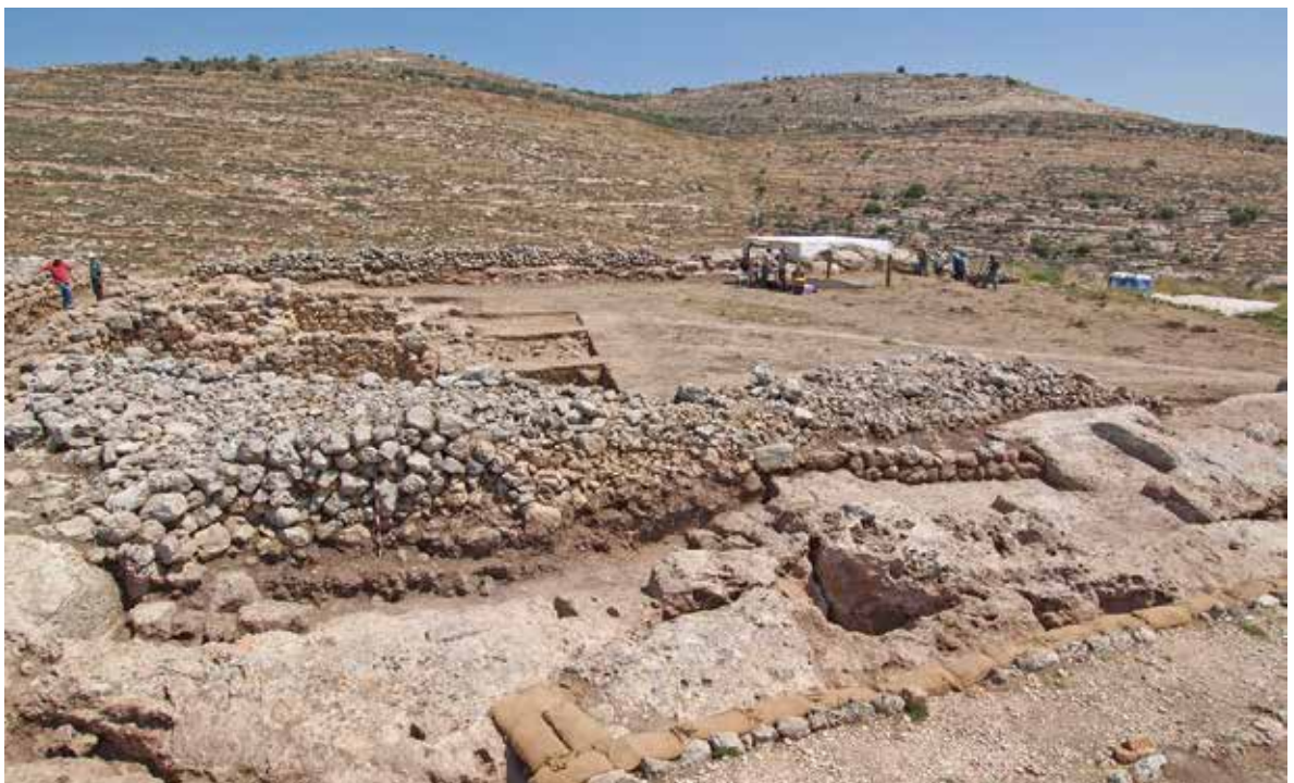
איורים 11: מבט על החפירות

מקירות הכנסייה התגלה באקראי חלק ממזבח ארבע קרניים אשר שימש כאבן בניה. הימצאותו של המזבח בחלק זה של האתר מחזק את השערתנו כי מקומו של היכל ה', כפי שמופיע בכתובים, נמצא בחלק הדרומי של התל ולא כדעת ייבין ופינקלשטיין (איור 10 - מזבח ארבע קרניים). תוואי הרחוב, ככל הנראה, משמר את