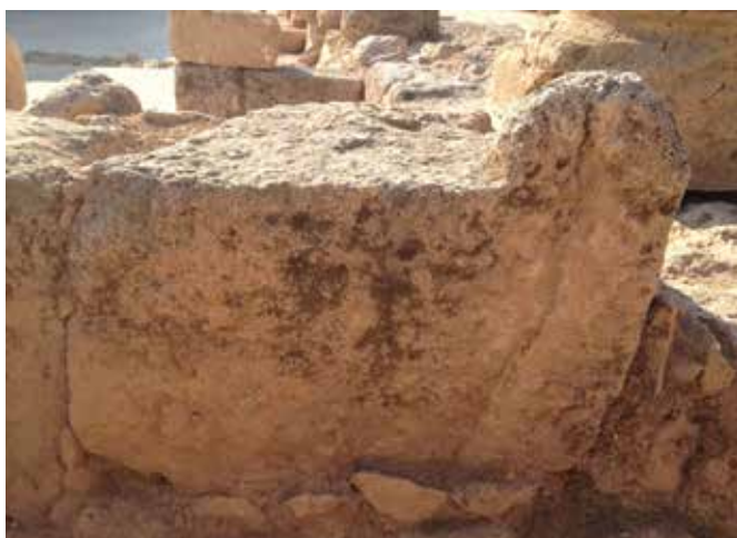
איור 9: מזבח ארבע קרניים

בחפירות המדרון הדרומי של האתר נחשף תוואי רחוב שהוביל ממכלול הכנסיות אל מרכז התל. באחד