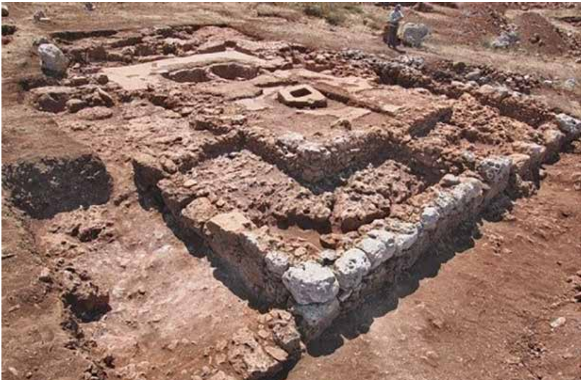
איור 15: גת