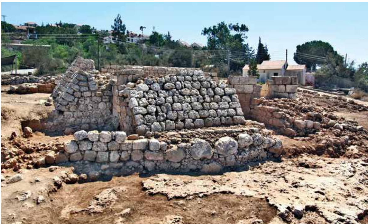
איור 14: מבט כללי על גיאמע א־סיתין

הסבר על המבנה. בכוונתנו בעתיד לשחזר את המבנה ולהציב את העמודים והכותרות שנמצאו במבנה, אף כי היו בשימוש משני (איור 15 - מבט כללי של גמע' א־סיתין).