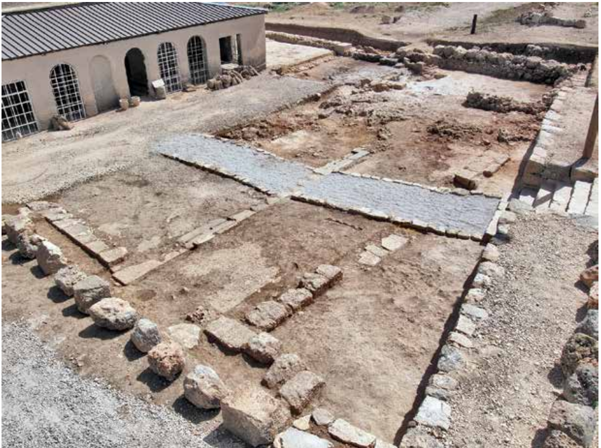
איור 6: חדרי הקפלה והמבנים באטריום

פולחן קדום, כגון כן פולחני, צלמית זאומורפית בדמות פר, טביעת חרפושית ועוד. בצמוד לחומה נמצאו חדרים שהשתמרו היטב שהכילו כלים רבים ששמשו לאחסון. כן נמצאו כלי נשק מברונזה, תכשיטים, כלי פולחן ועוד. מתקופת הברונזה המאוחרת, קודם לתקופת ההתנחלות, כמעט ולא נמצאו עדויות ארכיטקטוניות ועיקר הממצא הכיל כלי חרס מסוגים שונים ובכלל זה כלי יבוא. אחד בין הממצאים היו גם עצמות בעלי חיים. במקביל לחפירות י' פינקלשטיין, ערך ז' ייבין חפירות