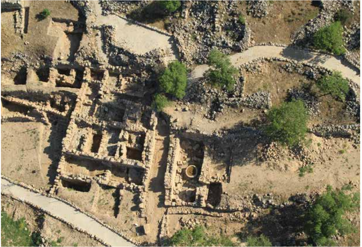
איור 10: מבט כללי על החפירות במדרון הדרומי

התוואי הקדום של העיר מתקופת הברונזה התיכונה וימי ההתנחלות בימי יהושע ושמואל, טרם חרבה העיר על ידי הפלישתים. ממערב לרחוב נחשף מבנה מתקופת הברזל (=הישראלית) שהשתמר לגובה של 2.5 מ' ושני מבנים גדולים המופרדים על ידי הרחוב. שני המבנים מתוארכים לתקופה הביזאנטית, אולם יסודותיהם נבנו על גבי קירות