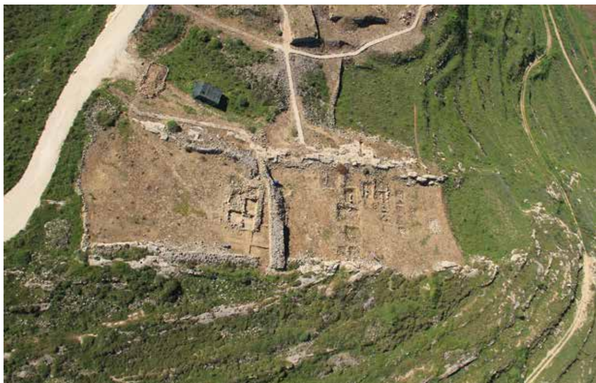
איור 8: המשטח הצפוני ממבט על