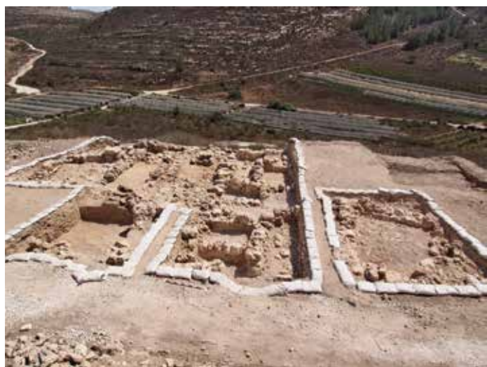
איורים 12: מבט על החפירות

במדרון המערבי של נערכה חפירה על מנת לאתר את הפינה הדרום מערבית של תוואי החומה מתקופת הברונזה התיכונה. בחפירה נחשפה החומה מתקופת הברונזה התיכונה והחלקלקה שנגשת אליה. מתקופת הברזל נמצאו שרידים מקוטעים עם שכבת אפר. מעל השכבות הקדומות נמצאו מבנים מהתקופה הרומית